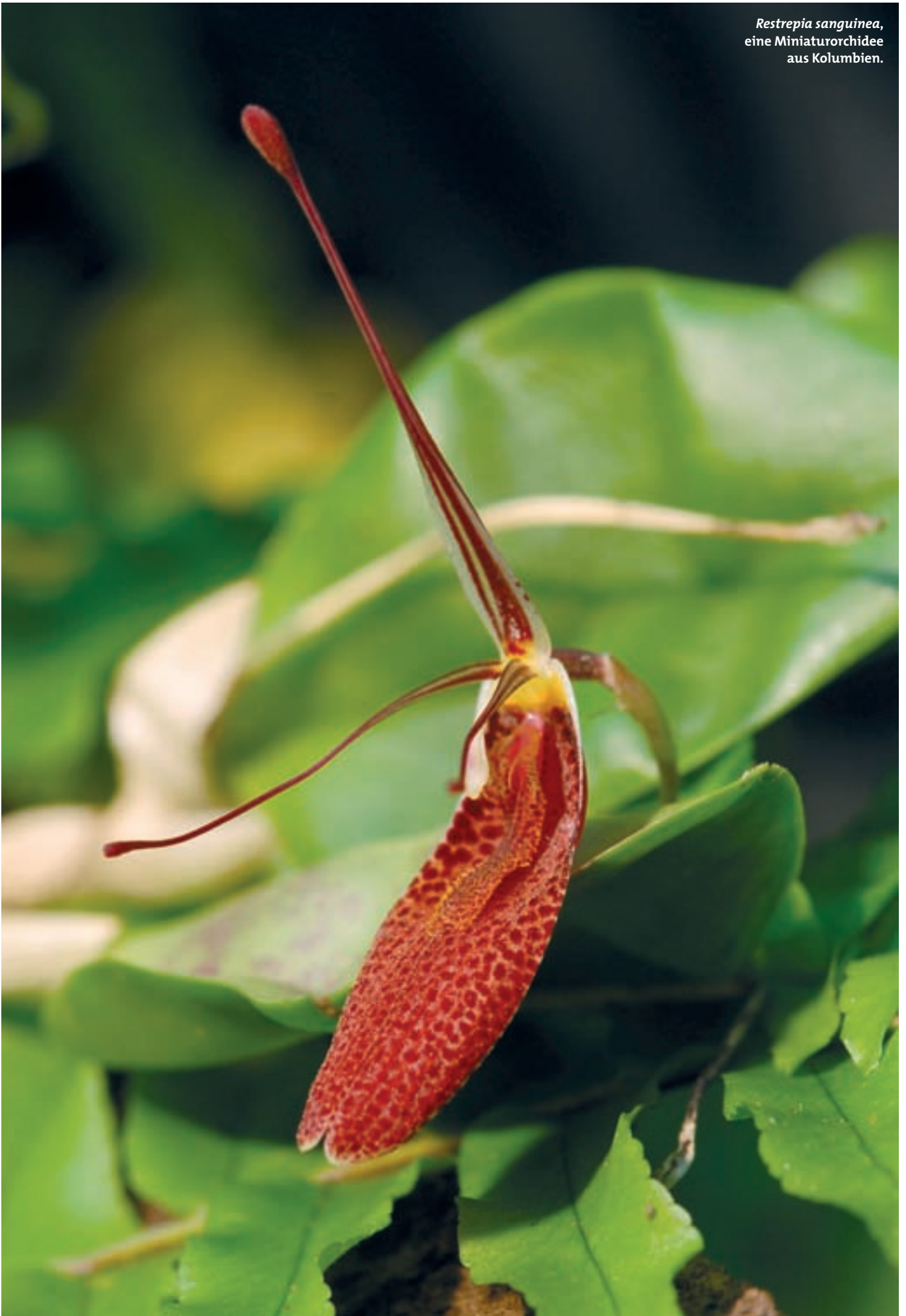
Restrepia sanguinea , eine Miniaturorchidee aus Kolumbien.