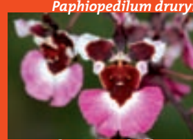
Tolumnia -Hybride, Syn. Onc. variegatum