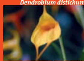
Masdevallia -Hybride 'Gelb'