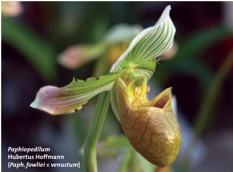
Paphiopedilum Hubertus Hoffmann ( Paph. fowleyi x venustum )

Wilhelm Hennis oder Hans Goebel, die sich in so manchem Stammbaum späterer Züchtungen wiederfinden, oder die beiden Oncidium (Syn. Odontioda ) Heinrich Hennis und Ira erwähnt – einen nicht unbedeutenden Platz unter den anerkannten Orchideenzüchtern der letzten Jahrzehnte gesichert.