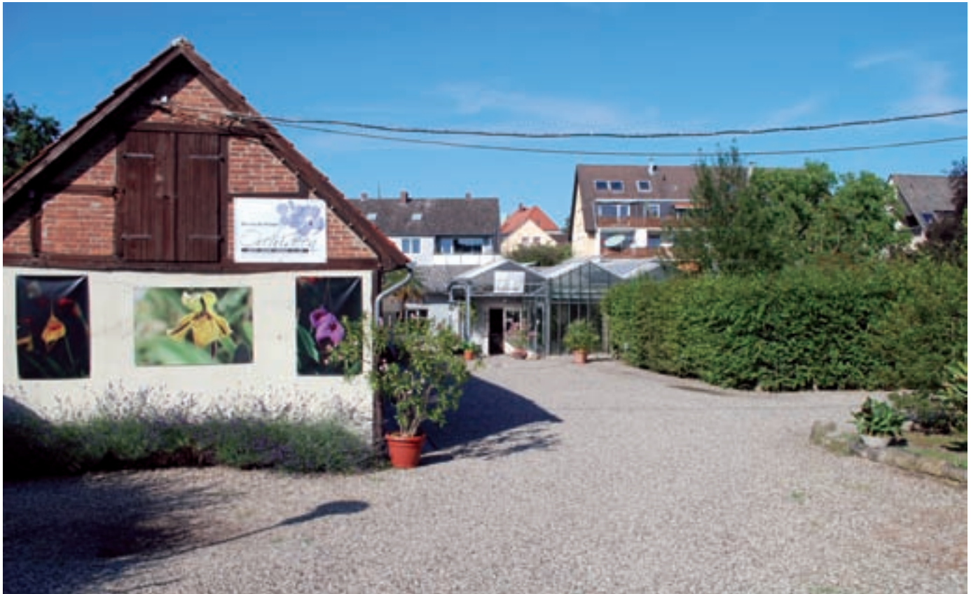
Hof und Eingangsbereich der Orchideengärtnerei HENNIS.