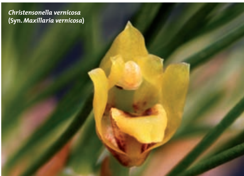
Christensonella vernicosa (Syn. Maxillaria vernicosa )

Hildesheim in ganz besonderem Maße ausgezeichnet. Das gilt umso mehr, als der Gartenbaubetrieb in der Großen Venedig in Hildesheim bis heute an der Tradition, seine Kundschaft mit attraktiven Naturformen, das heißt reinen botanischen Arten, zu beliefern, festgehalten hat.