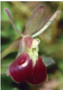
Epidendrum peperomia (Syn. Epi. porpax ) ist eine sehr wüchsige, epiphytisch wachsende Miniaturorchidee. Sie ist auch gut für die Kultur in der Vitrine geeignet.

Viele Naturformen, Jungpflanzen und Raritäten laden Orchideenliebhaber zum Stöbern im Verkaufsgewächshaus ein.