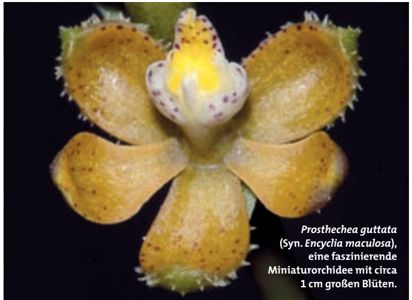
Prosthechea guttata (Syn. Encyclia maculosa ), eine faszinierende Miniaturorchidee mit circa 1 cm großen Blüten.