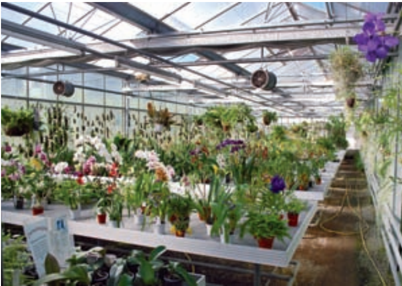
Verkaufsgewächshaus mit blühenden, für die Fensterbank geeigneten Orchideen.